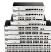
Gamas DGS-1210 y DGS-1510