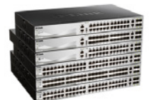
Gamas DGS-3120 y DGS-3130