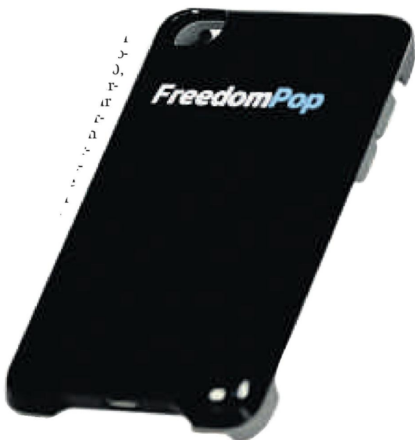
De Privacy Phone van Freedom Pop.