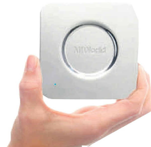
ME 1004 KPN AD Mi World 2