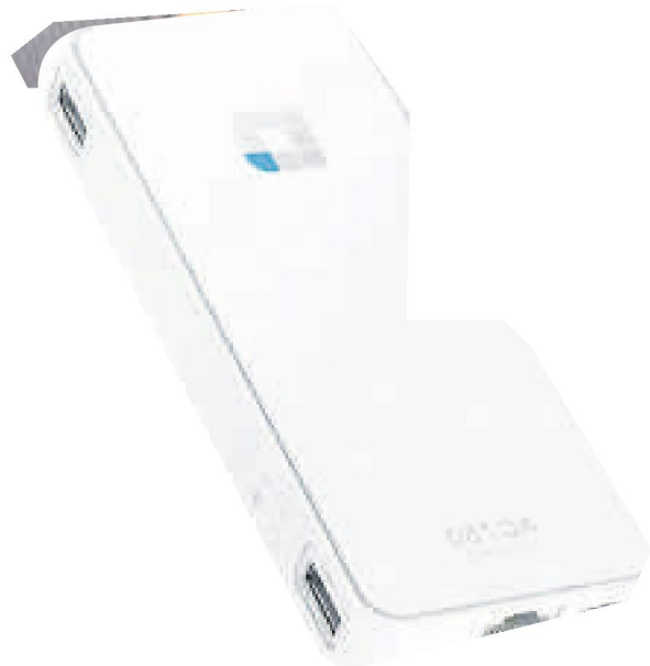
ME 1004 KPN AD D-link