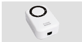
DHP-302 Powerline HD Ethernet Adapter

En l'absence de l'un de ces éléments, contactez votre revendeur.