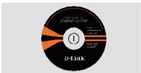
CD-ROM avec manuel utilisateur et Assistant d'installation