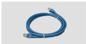
Câble Ethernet (UTP cat. 5)