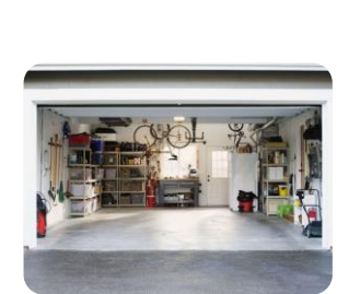
Parcheggio - Garage