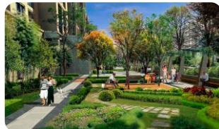
Cortile e giardino