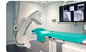
Sala esami clinici